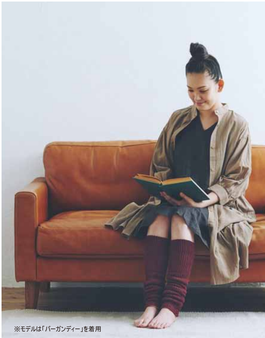
※モデルは「バーガンディー」を着用