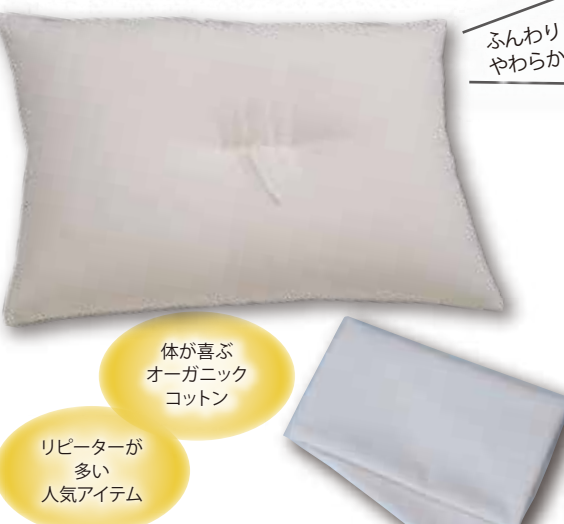
ふんわりやわらか

シンプル・イズ・ベスト! 農薬不使用で自然素材の安心感が魅力です。こだわりの布団職人が一つ一つ丁寧に作っています。真ん中をとじてあるので、頭を乗せたときに安定感があります。わたがしっかりと詰まっています、ふわふわです。