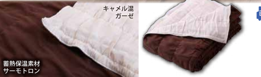
蓄熱保温素材サーモトロン

厚みがそれほどあるわけではないのに、ポカポカと芯から温まってくる感じがします。ムレたりもせず、朝まで快適に眠れました。 53歳女性