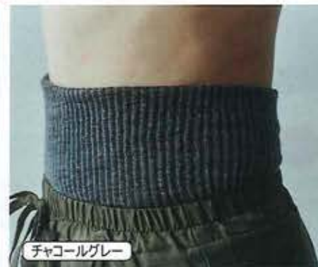
チャコールグレー