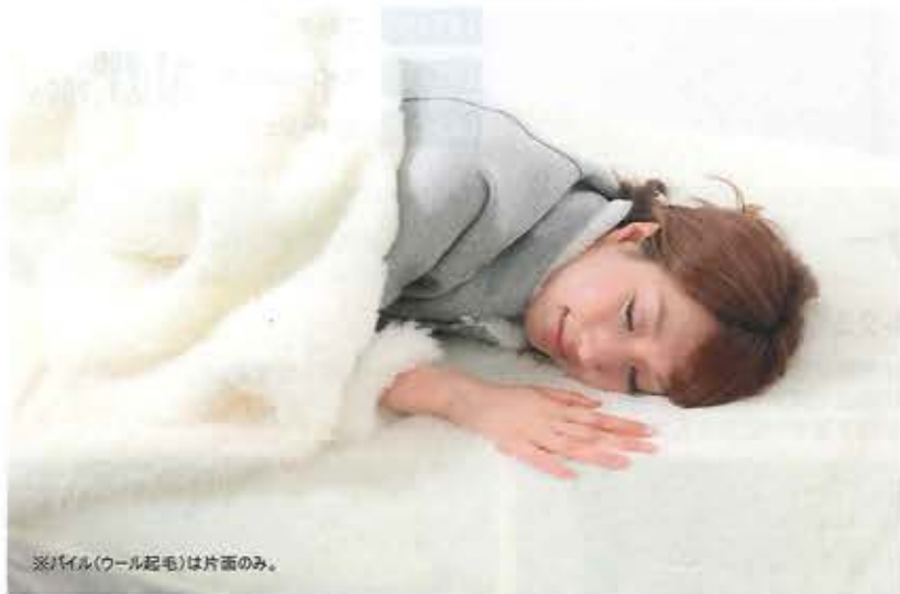
※パイル(ウール起毛)は片面のみ。

●素材/ 【表地】パイル:ウール100%(コリデール種) 【裏地】グランド:ポリエステル100%