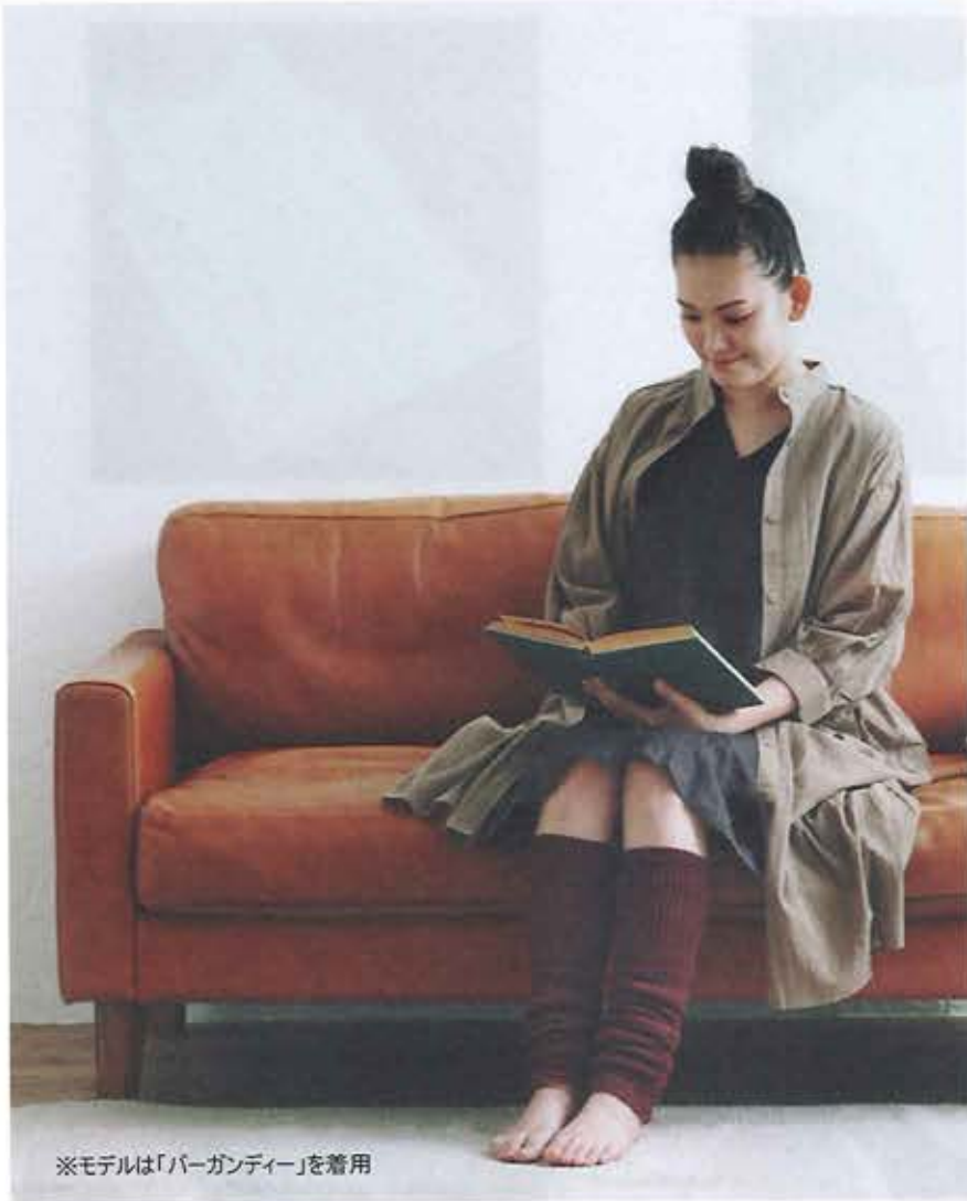
※モデルは「バーガンディー」を着用