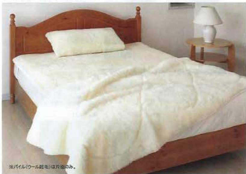
※パイル(ウール起毛)は片面のみ。

天然繊維100%の毛足の長い羊毛で、身体を自然なあたたかさでやさしく包んでくれるメリノンの毛布。寒い冬でも掛け毛布、敷き毛布セットで使えばよりあたたかく、深い眠りにつくことができます。体温であたたまった空気を逃がさず、朝まであたたかさが持続し、更に抜群の保温力でお肌を乾燥から守ってくれます。寒さで夜中に何度も目が覚めてしまう方、冬の乾燥が気になる方、睡眠の質を上げたい方におすすめです。