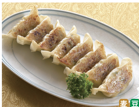
91502 野菜たっぷり餃子

12個(216g) 572円 新鮮な豚肉、野菜を信州塩尻の地酒笑亀を醸す麴で作った塩麴で熟成しました。