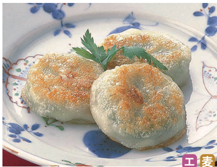
91510 海老にらまんじゅう

8個(192g) 670円 新鮮な豚肉と香味野菜を包みました。プリプリの海老も入った贅沢仕上げ。