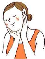
しっかり浸透させます