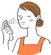
たっぷり噴きかけ