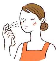
たっぷり噴きかけ