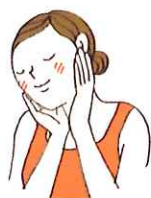
しっかり浸透させます