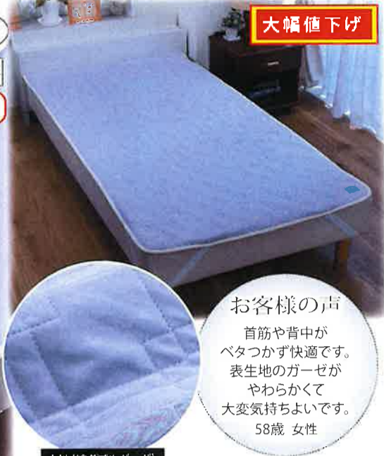
表地(綿ダブルガーゼ)

お客様の声 首筋や背中が べたつかず快適です。 表生地のガーゼが やわらかくて 大変気持ちよいです。 58歳 女性