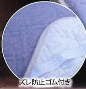
スレ防止ゴム付き