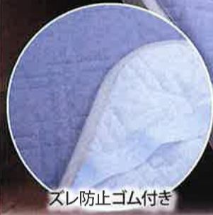
スレ防止ゴム付き