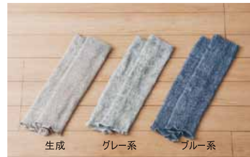
生成 グレー系 ブルー系

●素材 / 麻(リネン)51%・シルク(絹紡軸糸)39%・ポリエステル9%・ポリウレタン1% ●洗濯 / 洗濯機(ネット)