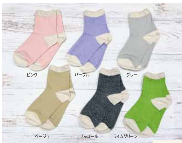
ピンク パープル グレー ベージュ チャコール ライムグリーン

シルク78%と高い混率が特長のショート丈ソックス。薄手で蒸れにくく、軽やかに履いていただけます。足口は広く、締め付け感を感じないフレア構造です。