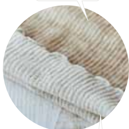
内側の白い部分がお肌に優しいシルク

●素材 / シルク49%・麻(リネン)44%・ナイロン6%・ポリウレタン1% ●サイズ / M-L: ウエスト64-77cm ●洗濯 / 洗濯機(ネット)