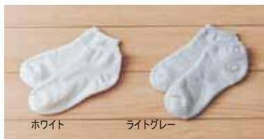
ホワイト ライトグレー