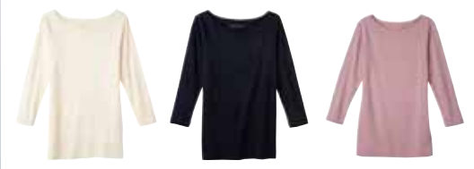
生成 ブラック ピーチピンク

素材 / 綿(オーガニックコットン)100% サイズ M: バスト79-87、肩幅34、袖丈44.5、身丈61.5cm L: バスト86-94、肩幅35、袖丈45.5、身丈63.4cm 洗濯 / 洗濯機(ネット) インド製