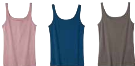
ピーチピンク ブルー系 ブラウン

素材 / 綿(オーガニックコットン)100% サイズ M: バスト79-87、肩幅29.5、身丈55.5cm L: バスト86-94、肩幅30.5、身丈57.5cm 洗濯 / 洗濯機(ネット) インド製