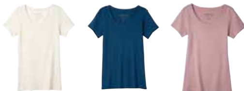
生成 ブルー系 ピーチピンク

素材 / 綿(オーガニックコットン)100% サイズ / M: バスト79-87、肩幅33.5、袖丈15、身丈60cm、L: バスト86-94、肩幅34.5、袖丈16、身丈62cm 洗濯 / 洗濯機(ネット) インド製