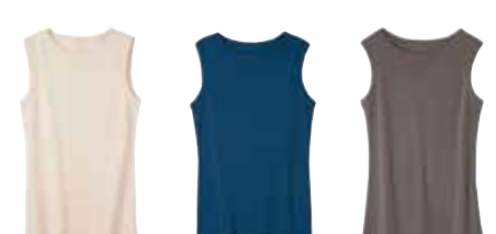
生成 ブルー系 ブラウン

素材 / 綿(オーガニックコットン)100% サイズ M: バスト79-87、肩幅33、身丈61cm L: バスト86-94、肩幅34、身丈63cm 洗濯 / 洗濯機(ネット) インド製