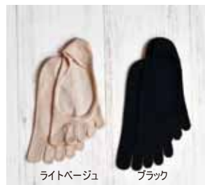
ライトベージュ ブラック

薄手のシルク生地だから、蒸れやすいパンプスの中もさわやかに保ってくれます。かかところにシリコン製の滑り止めを付けて脱げにくくしています。