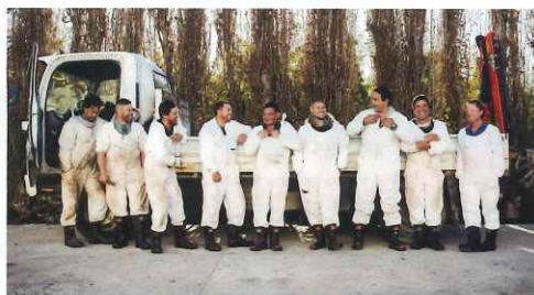
【熟練の契約養蜂家たち】