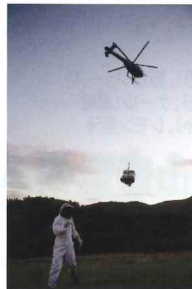
【トラックも入れない様な採蜜場 まではヘリコプターで巣箱を移動】