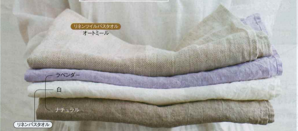
リネンツイルバスタオル オートミール