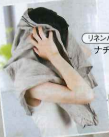
リネンバスタオル ナチュラル