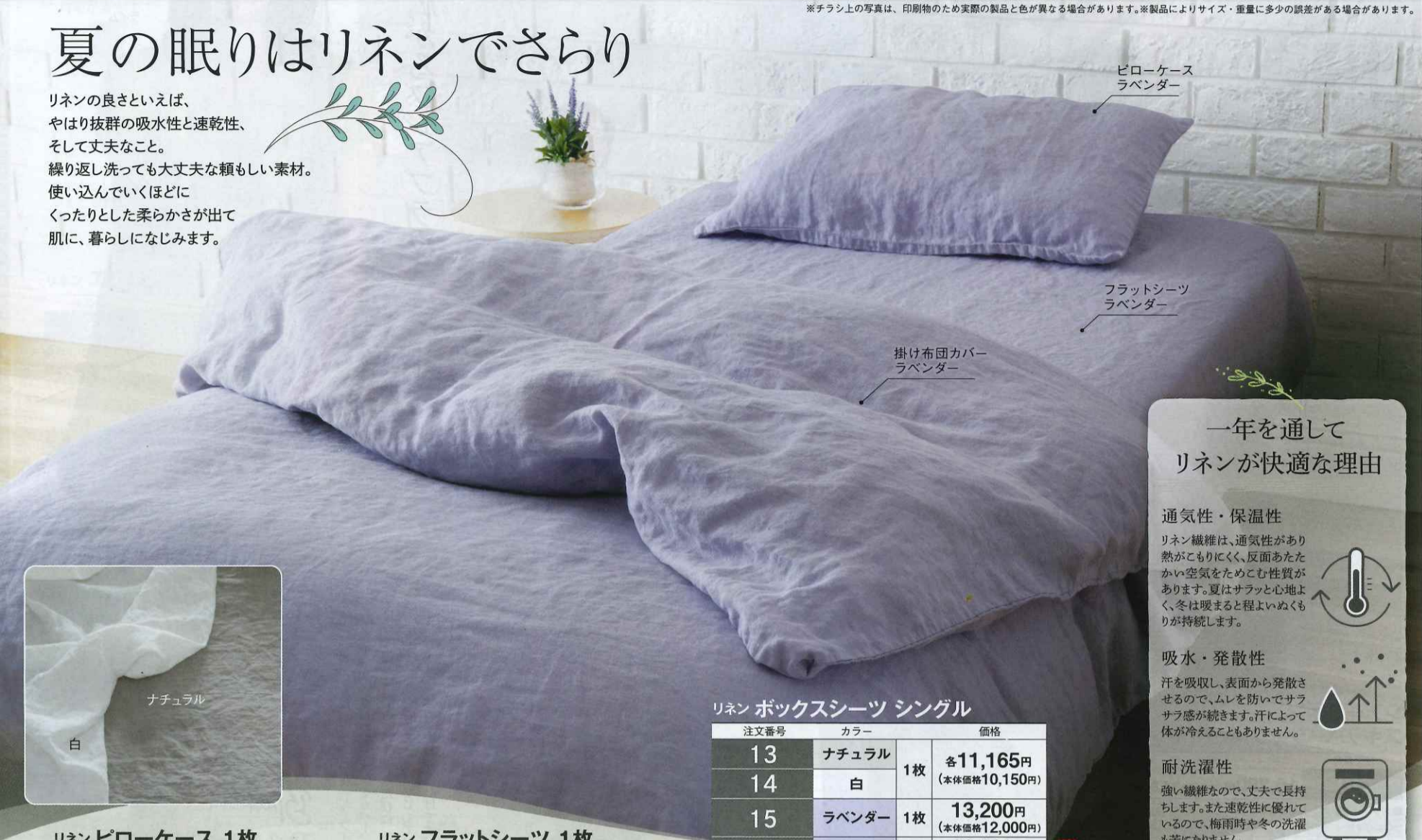
ピローケース ラベンダー