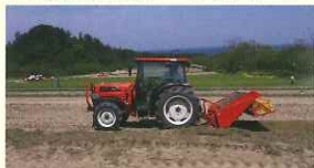
トラクターでらっきょうを掘り上げる