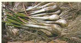
掘り上げ後のらっきょう