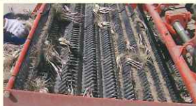
らっきょう掘り機