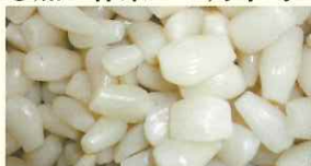
加工前のらっきょう