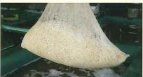
低温で塩漬け保管