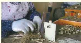
一球一球丁寧に手で根と茎を切る