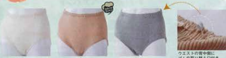
生成り 茶 グレー