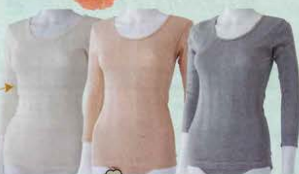
生成り 茶 グレー

オーガニックコットン リブフリース8分袖 各4,598円(本体価格4,180円)