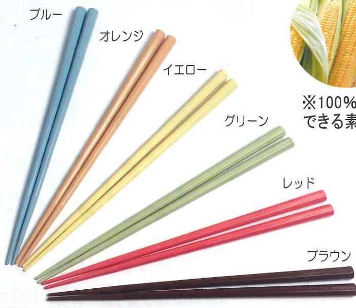
豊富な6色のカラーバリエーション